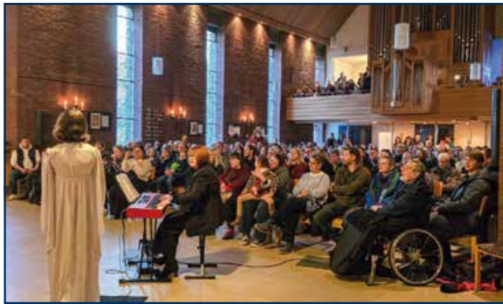
Singende Gemeinde beim Krippenspiel

Genau darum geht es bei der Aktion Monatsliebling: Wir suchen Ihr persönliches Lieblingslied! Ob Kirchenlied, Schlager, Pop-Song, Volkslied oder geistliches Lied – schicken Sie uns Ihren Liedliebling und helfen Sie mit, die musikalische Vielfalt unserer Gemeinde mitzugestalten.