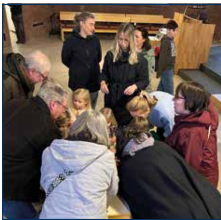
Große und kleine Menschen im Einsatz