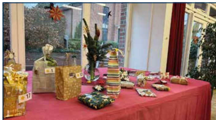
Die Wichtelgeschenke auf dem Gabentisch