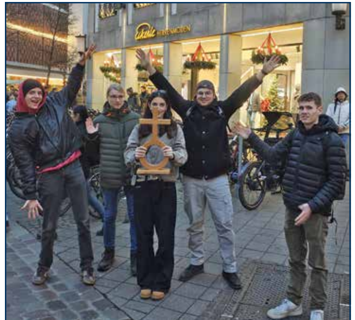
Auch das Team hat die Freizeit genutzt – immer dabei: das Kreuz auf der Weltkugel