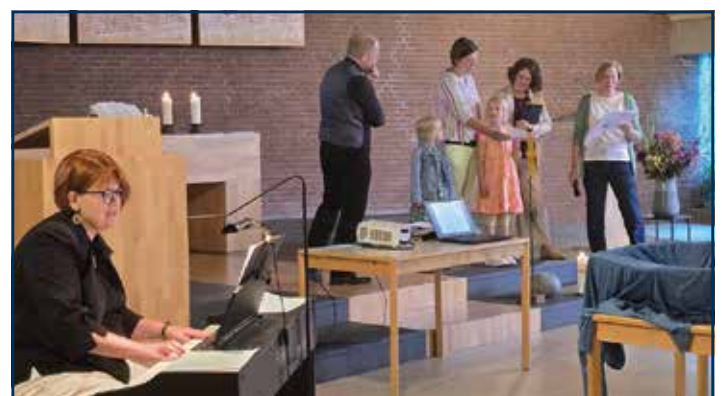
„Gottesdienst mit kleinen und großen Leuten“