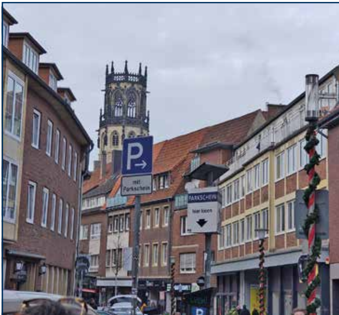
Andacht in der St.-Ludgeri-Kirche (im Hintergrund)