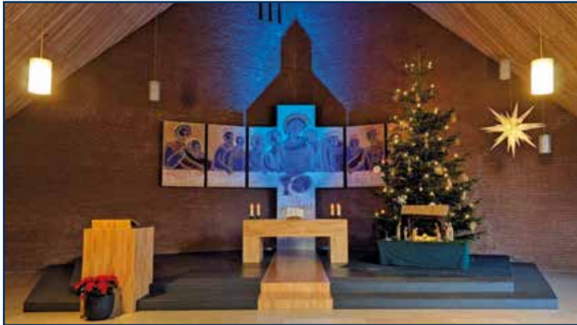
Die weihnachtliche Gustav-Adolf-Kirche

Dieses Mal war ich nicht als Pastor im Dienst. Als Gottesdienstbesucher und ehrenamtlicher „Küster“ habe ich diesen Nachmittag und Abend erlebt.