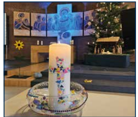
Nicht fehlen darf die selbstgebastelte Kerze.