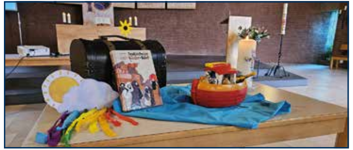
Die Geschichte von der Arche Noah – bildlich dargestellt mit Verkleidung