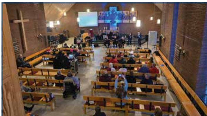
Meet `n` Sing Band