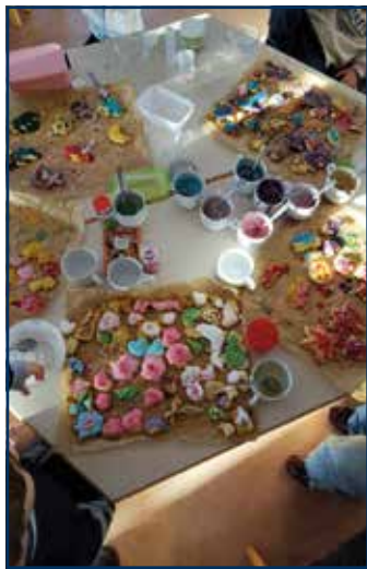
Viele Farben für die Deko

war der Grundgedanke des besinnlichen Backtags. Am 21.12.2025, einem Sonntagnachmittag, war es dann so weit, und wir trafen uns im Kastanienzimmer des Gemeindehauses. Plätzchenteig war bereits vorbereitet, einige Teamer hatten Ausstechförmchen, Zuckerguss sowie verschiedene Streusel, Zuckerperlen und Dekorationen mitgebracht. Zuerst stachen wir Teamer mit unseren ganz jungen Gemeindegliedern (im Alter von 3 bis 10 Jahren) die Kekse aus. Viele unterschiedliche und individuell gestaltete Ergebnisse entstanden. Beim Backen verbreitete sich der Duft frischer Plätzchen im Gemeindehaus. Anschließend bepinselten alle die noch warmen Plätzchen mit vielen Farben und verzierten sie mit bunten Streuseln. Natürlich wurde danach auch von den fertigen Plätzchen genascht. Auch das gehört schließlich dazu. ☺! Es blieb aber genügend übrig, sodass jedes Kind eine Auswahl mit nach Hause nehmen konnte.