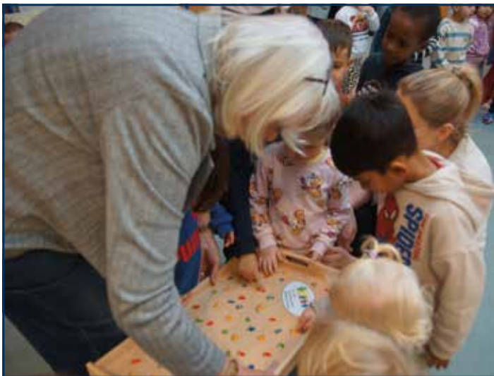
Hier überreichen die Kinder das selber gestaltete Geschenk.