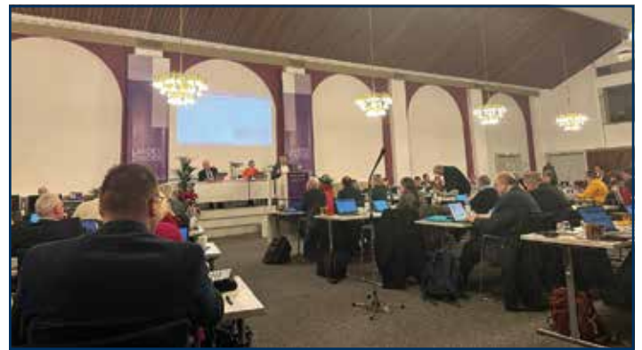
Sitzung im großen Plenarsaal