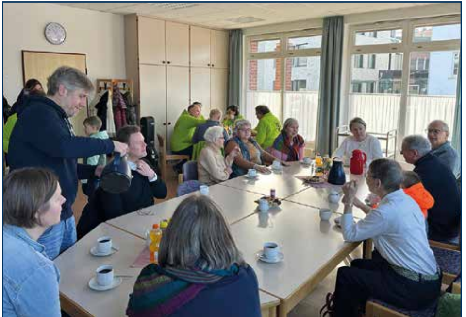
Gut besuchter Kirchenkaffee nach dem „Gottesdienst mit kleinen und großen Leuten“ am 15. Februar 2026

Termine: • 15. März 2026 • 06. April 2026 Ostermontag • 10. Mai 2026 • 21. Juni 2026