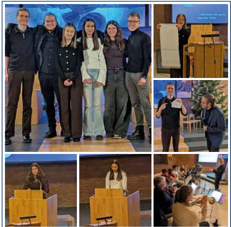
Unser Team – Checkliste – Deko – Lesung – Auslegung – Gebet – Ev. Posaunenchor Meppen