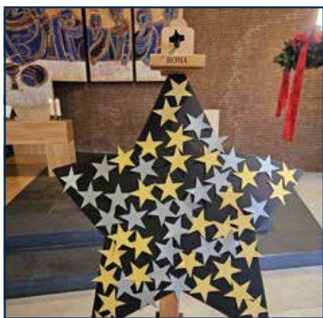
Thema am 1. Advent: Ein Licht für andere sein