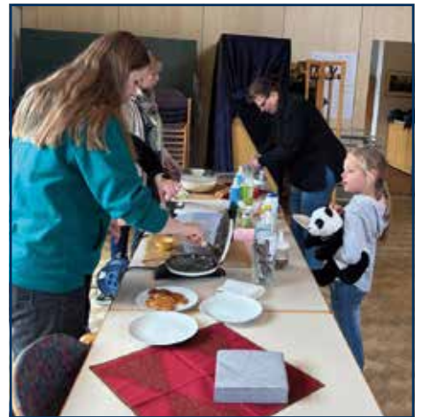
Im Anschluss an den „Gottesdienst mit kleinen und großen Leuten“ am 1. Advent und der Aktion „Brot für die Welt“ fand das Waffelbacken mit der Kita im Gemeindesaal statt.