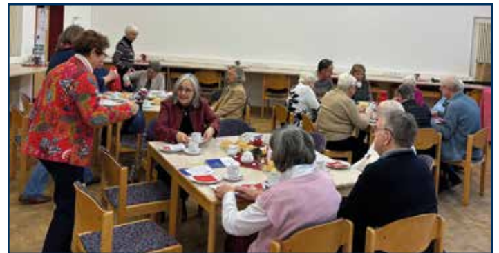
Kaffeetrinken im Gemeindesaal