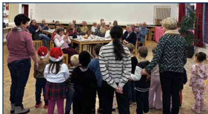
Die Kinder der Kita Matthias Claudius führen eine eingeübte Adventsgeschichte vor.