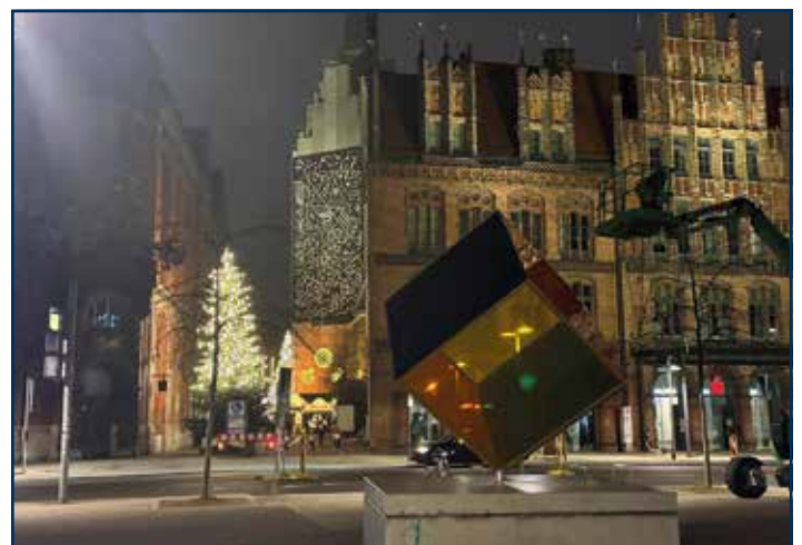
Vorweihnachtliche Stimmung in Hannover

Handwerk in 4. Generation Fachwissen seit über 110 Jahren