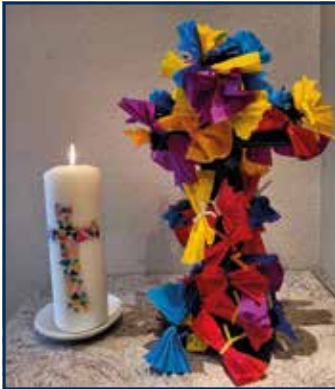
Bemalte Kieselsteine (oben) und die Osterkerze mit bunt geschmücktem Kreuz