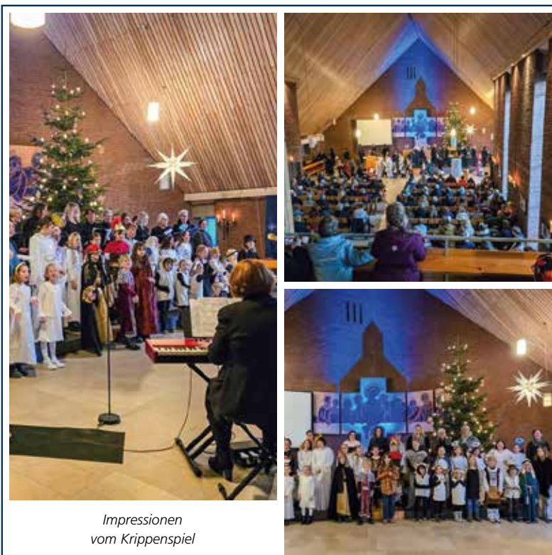
Impressionen vom Krippenspiel