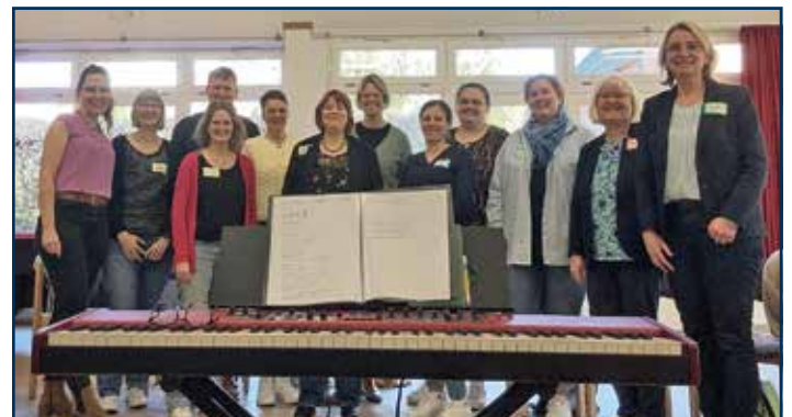
Beteiligte des „Teambuilding by Singing“