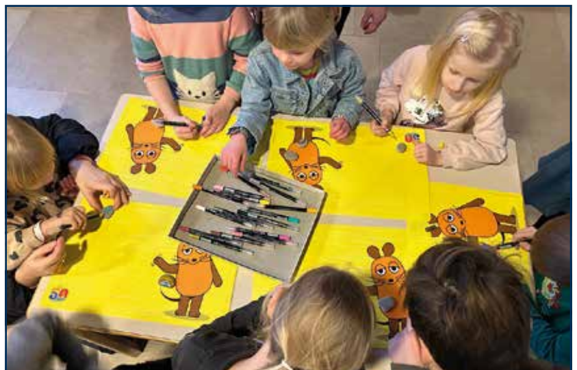
Manchmal wird im „Gottesdienst mit kleinen und großen Leuten“ gemalt. Die bunt dekorierten Kieselsteine dürfen die Kinder zur Erinnerung mit nach Hause nehmen.