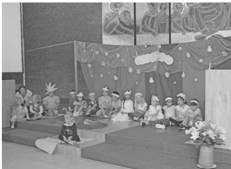
Das Stück „Die kleine Raupe Nimmersatt“ wurde in der Kirche aufgeführt.

Alle Erzieherinnen der Kindertagesstätte Matthias Claudius