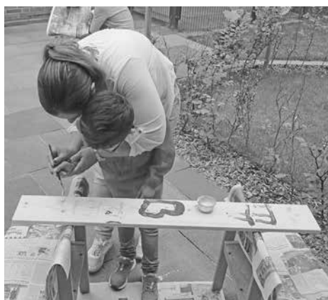
Zur Erinnerung an die Kindergartenzeit durften die Kinder Holzbretter gestalten.