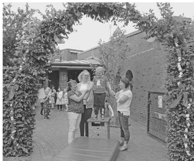
Der traditionelle „Rauschmiss“ aus dem Kindergarten